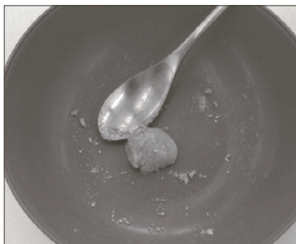
[ちょうど良いとき] ▶ 1つにまとまって泥団子のようになります