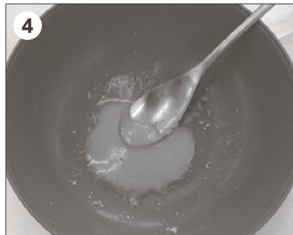
4 水がちょっと多いとき ▶ ベチャベチャします。でも、それが好きな子もいます