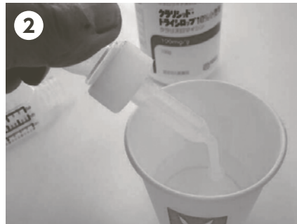
2 スポイトで水を取る (15mLくらい)