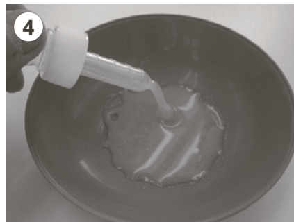
4 スポイトでかき混ぜる (薬を溶かす必要はありません)