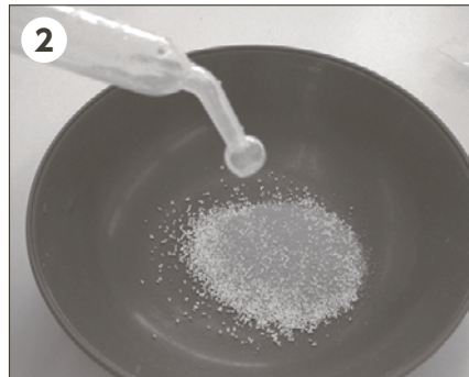
2 水をスポイトで1滴ずつ加える(スプーンも可)