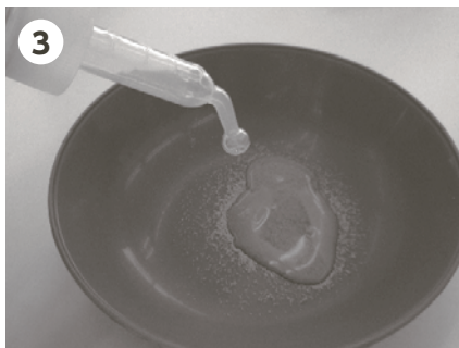
3 スポイトの水を小皿に入れる