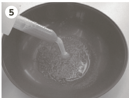
5 全量をスポイトで吸い取る