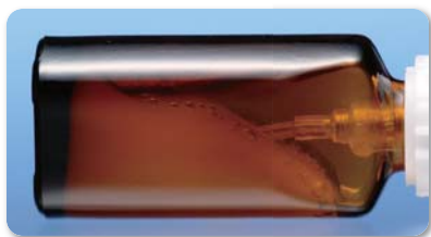
2日間放置後の薬液の状態